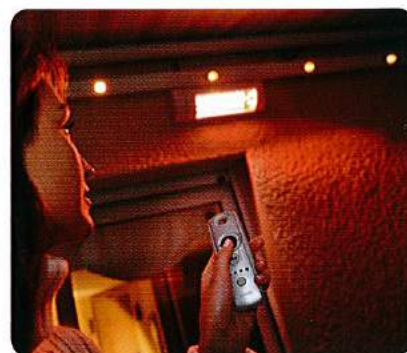
Un mando a distancia para tu terraza

¿Ya tienes un plafón de iluminación o un calefactor? Con los receptores radio RTS puedes incorporar el confort del mando a distancia a estos elementos. Los receptores radio son compactos y se disimulan fácilmente, integrándose a la perfección en la fachada. Consulta a tu instalador.