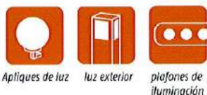
Apliques de luz luz exterior plafones de iluminación

➤ Nada mejor que disfrutar de una cena o una copa con familiares y amigos en el confort de tu terraza. De noche, el mismo mando a distancia te sirve para controlar la luz de la terraza o jardín y la de dentro de casa.